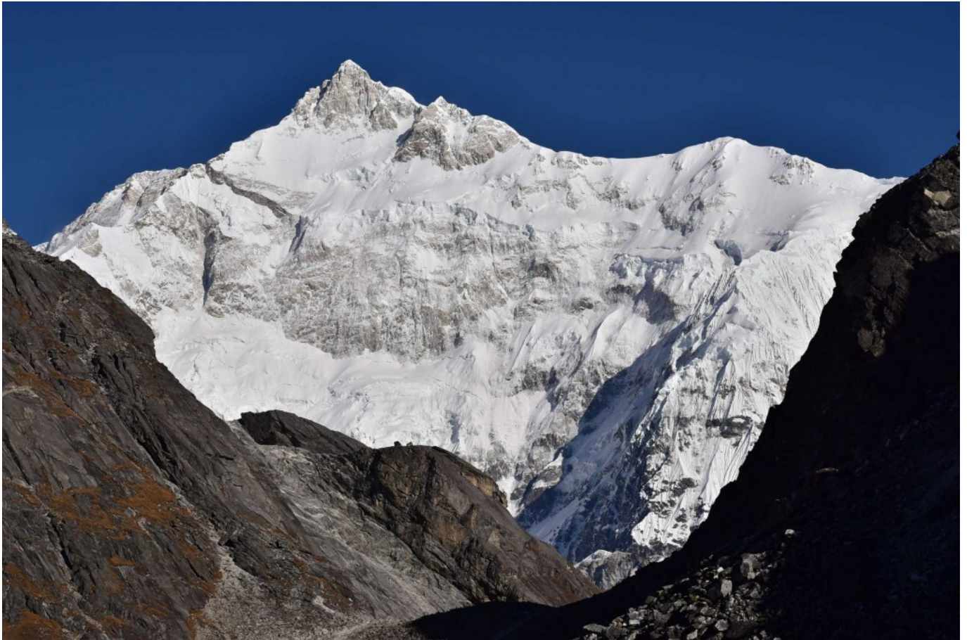
Goeche La - der Höhepunkt der Reise.