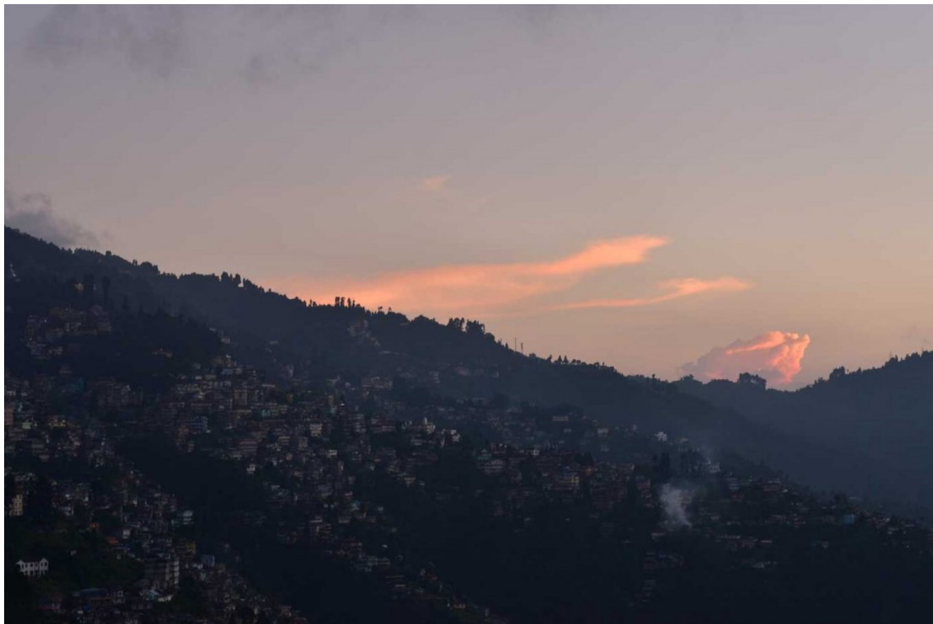
Darjeeling – die Königin der Hills – war ein beliebter Rückzugsort der Briten.