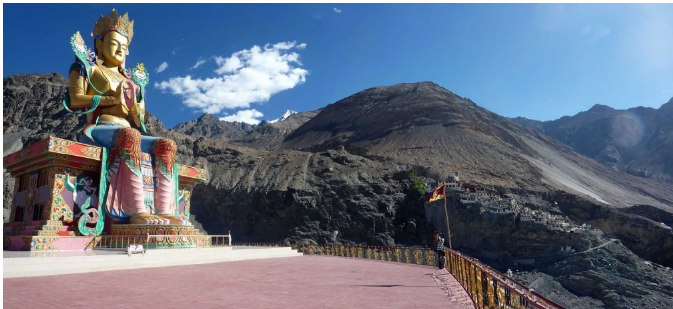
Kloster Diskit