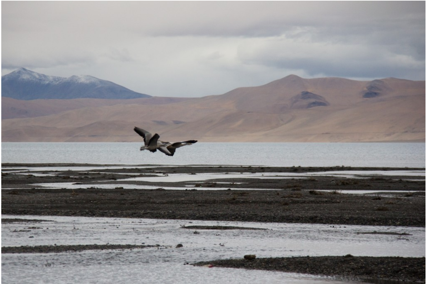
Am Tsokar (c) Barbara Esser