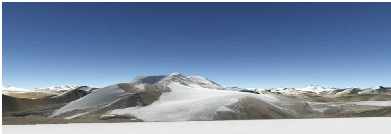
Spangnak Ri (6.380m)