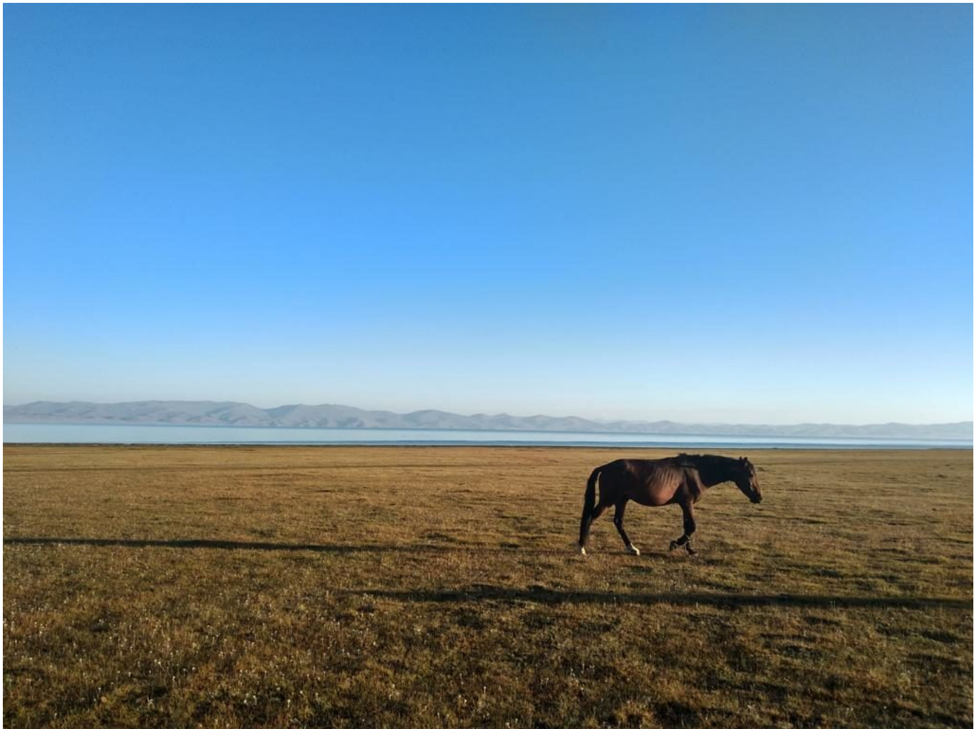
Der See Son Kul

Frühstück in Jurten. Wir wandern am Morgen vom Becken des Sees auf Höhe 3030m über die Song-Kol-Berge und den Jalgyz Karagai-Pass (3300 m) ins Tal von Kilemche. Der morgendliche Aufstieg bietet wunderbare Ausblicke auf das Panorama des Song-Kul-Sees. Der Pass selbst ist felsig und aufregend. Übernachtung und Abendessen im Yurt Camp der Hirten (2.800m). 4-5 Stunden zu Fuß. F,M,AD