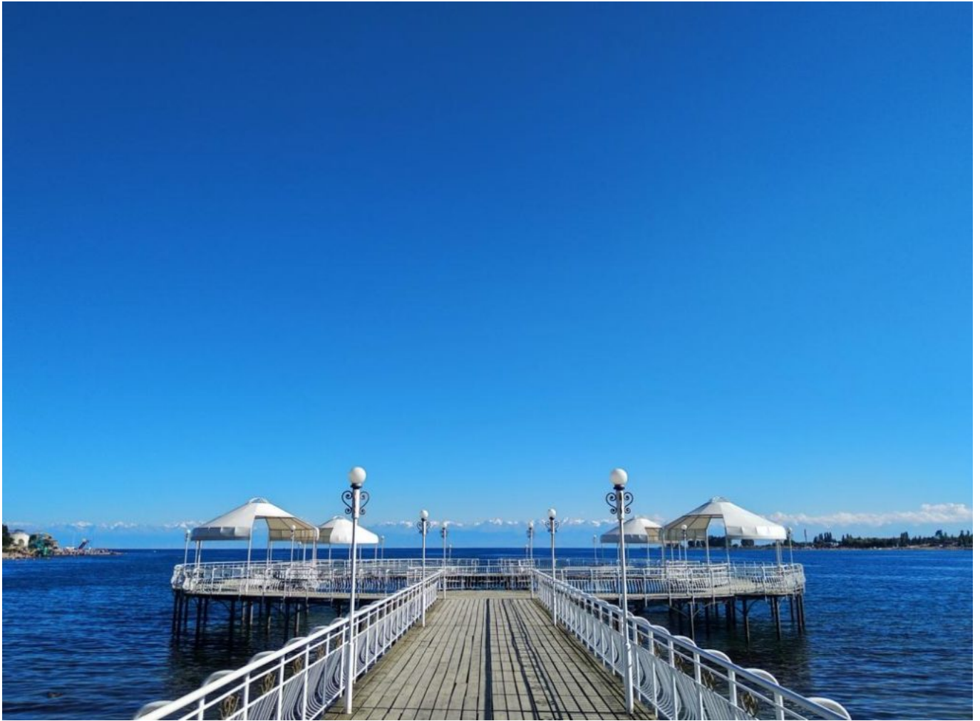
Cholpon-Ata am Issyk Kul

der alten Stadt Balasagun auf der Rocca-Seidenstraße (11. Jh.). Nach der Ankunft Wanderung in einer Schlucht. Abendessen und Unterkunft in Familienpension. F,M,A